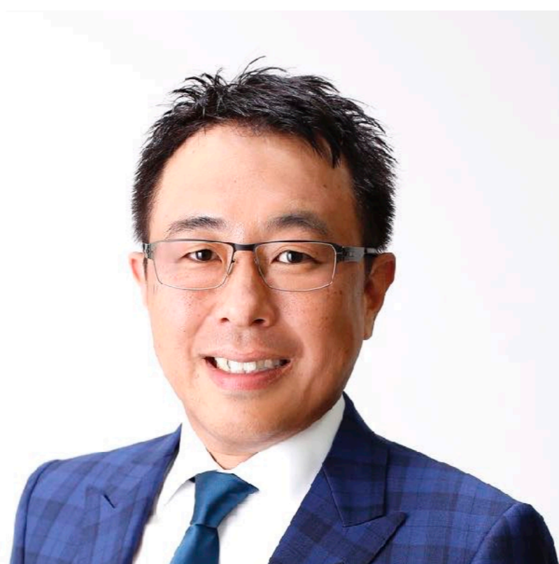
Endodontics 神戸 良